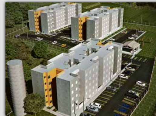
Monte Serrat Salto-SP