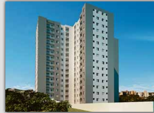
Vista Cantareira Guarulhos-SP