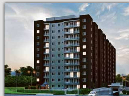
Varandas Jardim do Lago Campinas-SP